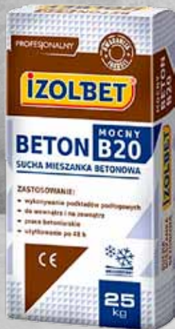
BETON MOCNY B20 25 kg