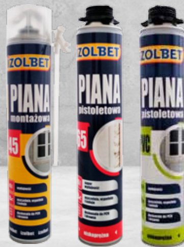
PIANY różne rodzaje