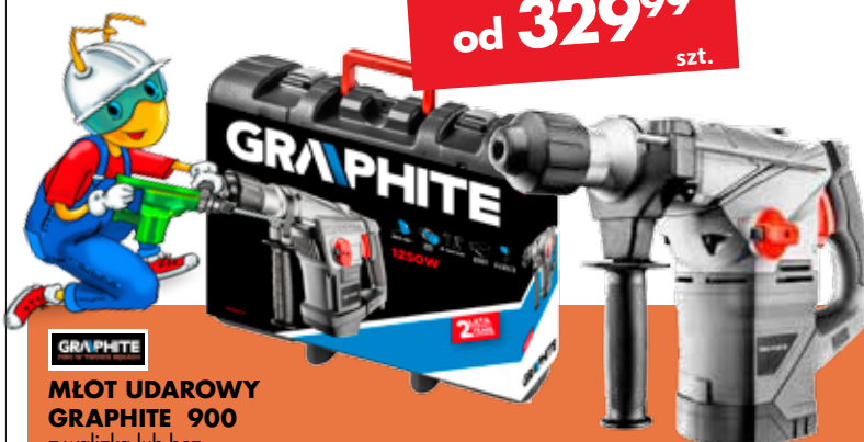
MŁOT UDAROWY GRAPHITE 900 z walizką lub bez

SPRÓBUJ PAYBACK Sprawdź stan swojego konta PAYBACK przy kasie. PUNKTUJ SZYBCIEJ W PONIEDZIAŁKI!