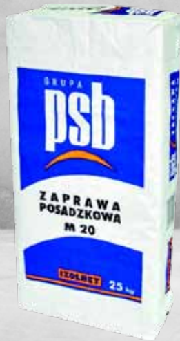
ZAPRAWA POSADZKOWA PSB ZP-CM 20 25 kg